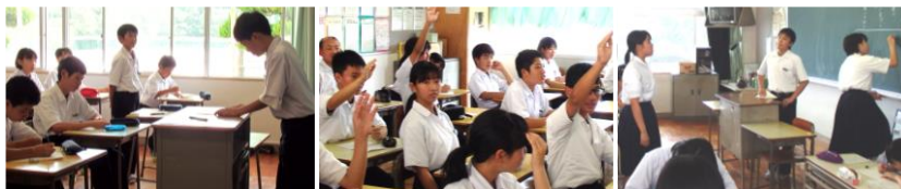
話し合いの様子です [左から1年生、2年生、3年生]

19日(水)の学活では、学級委員が司会を行い、給食時間がどうすればより充実するかについて、話し合いました。「給食の準備が遅いと食べる時間がなくなる」「放送があるときに話をしている人がいる」など、まずは気になる点を出し合いました。その後、解決策について、個人、グループの意見を出し合うことで、どのクラスも活気ある話し合いができました。7月2日(火)に行われる生徒総会が楽しみです。