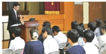
1、2年生の保護者も多く参加されました