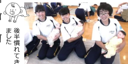
後半慣れてきました

21日(金)、3年A組がみちがみ病院に行き、赤ちゃんとおふれあいました。B組は28日(金)です。