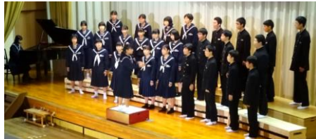
3年B組「未来」金賞【コンクール大賞】