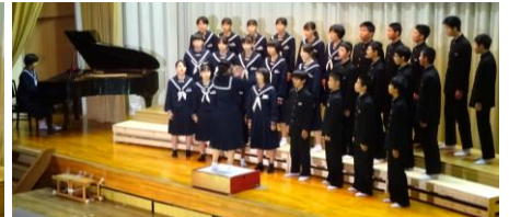
3年A組「聞こえる」金賞