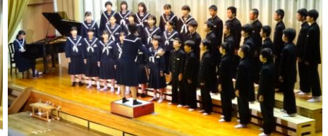
2年A組「空駆ける天馬」金賞