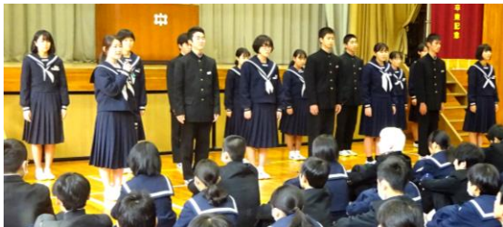
全校生徒の前で挨拶をする令和元年度の生徒会役員のみなさん

Ⅱ期の最終日に行った生徒会役員解任式では、一人ひとりが今までの思いを込めて挨拶をしました。その後、校長先生が今までの功績をねぎらい、式を締めくくりました。