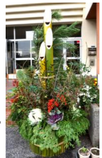
生徒会リーダーが作った門松

令和2年の幕が開け、今日から3期が始まりました。これから始まる3期は、 今年度の締めくくりであり、4月からの新しい生活を迎えるための準備期間でもあります。