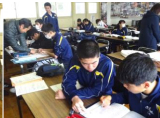
3年生〔3階ラーニングI〕