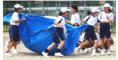
初めての体育祭に向けて1年生も頑張りました