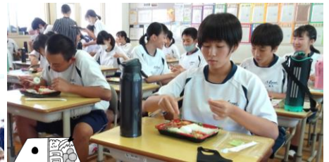
3年生はみんなでお弁当を食べて、午後の授業に臨みました。午後もしっかり頑張りました。 8/28(金)撮影