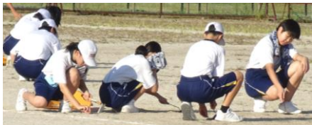
体育祭実行委員や有志の人が集まり、朝は多くの生徒がボランティアで草引きをしました！ 8/26(水)撮影

昼の時間には、多くの1、2年生が進んで学習会に参加しました。学習会が終わると「ありがとうございました」と感謝の気持ちを表して音楽室を後にしました。 8/25(火)撮影