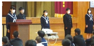
11月の委員会目標の発表です