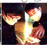
キャンドルサービス