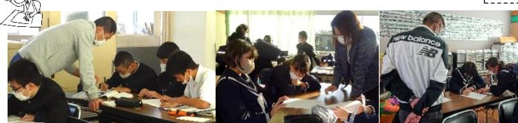
教員が全力でサポートしています

次回は16日(月)15:30~16:30です。「定期テスト3」に向けて積極的に活用してほしいと思います。-4日(水)-