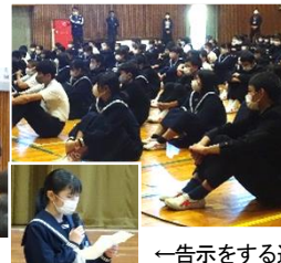
←告示をする選挙管理委員長